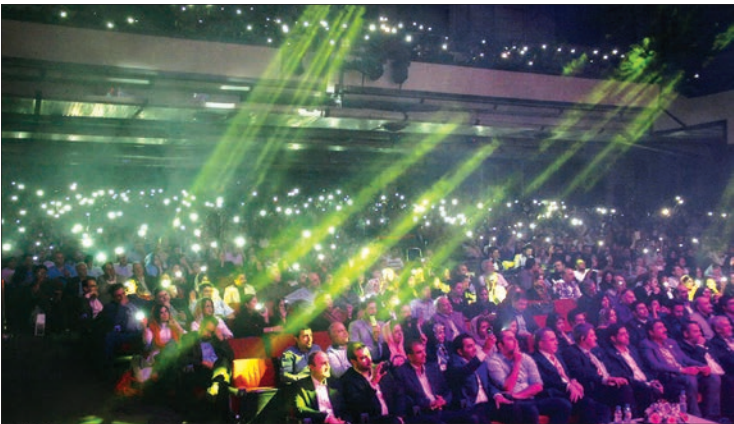
همچنین عنوان کرد: با برگزاری کنسرت در سراسر کشور مخالف چون کنسرت، هنر کش است. مابانی زیارت است. نماینده ولی فقیه در استان خراسان رضوی

سیداحمد علم‌الهدی امام جمعه مشهد که طی چند سال اخیر همواره نظراتش درباره موسیقی با واکنش‌های متفاوتی روبه‌رو شده؛ در تازه‌ترین سخنانش از حرام نبودن موسیقی و گوش دادنش به برخی از آهنگ‌ها گفته است البته او با هم تأکید کرده که: مخالفان سرسخت کنسرت‌هاست. به گزارش ایلنا، حجت‌الاسلام سیداحمد علم‌الهدی امام جمعه مشهد عصر روز گذشته درباره هنر موسیقی گفت: بنده هنر نیستیم، خود را بیش از هنرمندان طرفدار هنر می‌دانم چون اگر هنر در مسیر تعالی انسانی قرار گیرد، بهترین عبادت است. وی در ادامه افزود: مخالفت من با هتل‌سازی، ساخت مراکز تفریحی و برنامه‌های گردشگری دروغ است. پذیرفتن حرف دیگران به نقل از من و نشنیدن حقیقت از زبان خودم، خلاف روحیه علمی و تحقیقی شماست، نه ضد گردشگری و نه ضد هتل حرف زده‌ام؛ گفت‌وگو مشهد فضای گردشگری نیست، فضای