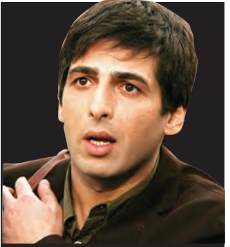
پاسخ حمید گودرزی به یغما گلروبی شرف باید داشت...