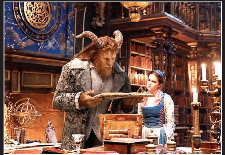
فرش جهانی فیلم دیو و دلبر از ریز میلبار در گذشت