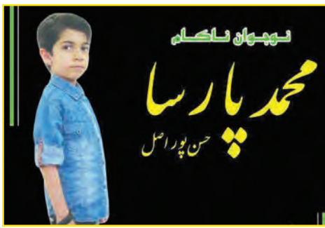
یکی از قربانیان حادثه