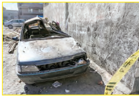
یکی از قربانیان حادثه