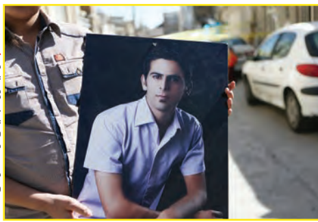
یکی از قربانیان حادثه