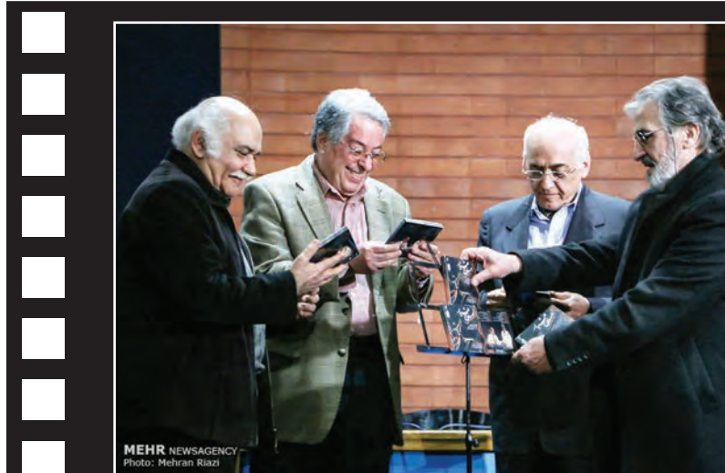
مراسم رونمایی از آلبوم «مست هشیار» با استقبال از کم‌توجهی به موسیقی سنتی ایران برگزار شد.