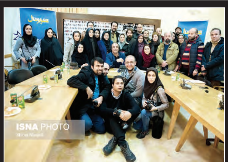
اینجا خانه هنر من است. محل برگزاری نشست خبری چهارمین جشنواره تصویری سال با حضور سیف اله صمدیان و عکاسان و دیگر نگاران رسانه‌ها