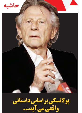
جافار پناهی، کارگردان محبوب و پرتعدادترین فیلم‌های ایران