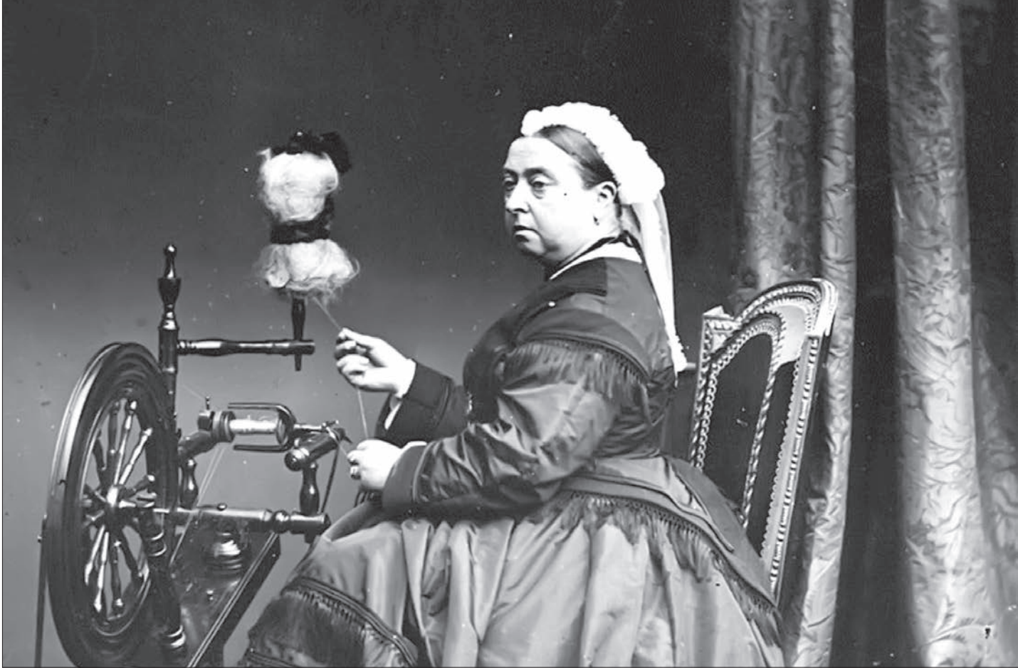
۱۱۶ سال پیش، برابری بیست و دوم ژانویه ۱۹۰۱ میلادی، ملکه ویکتوریا، ملکه پادشاهی متحد بریتانیا، ایرلند و امپراتریس هند در ۸۱ سالگی درگذشت. ویکتوریا، ۶۳ ساله و ۷ ماه و ۲ روز بر امپراتوری بریتانیا سلطنت کرد. او از لحاظ طول دوره زمامداری پس از نوه پسریش، الیزابت دوم (ملکه فعلی)، در تمام تاریخ بریتانیا طولانی‌ترین دوره سلطنت را کرد. دوره حکومت او با گسترش عظیم امپراتوری بریتانیا همراه بود. دوره ویکتوریا یکی از اوج انقلاب صنعتی بود. دوره‌های از تغییرات عظیم اجتماعی، اقتصادی و فناوری در پادشاهی متحد.