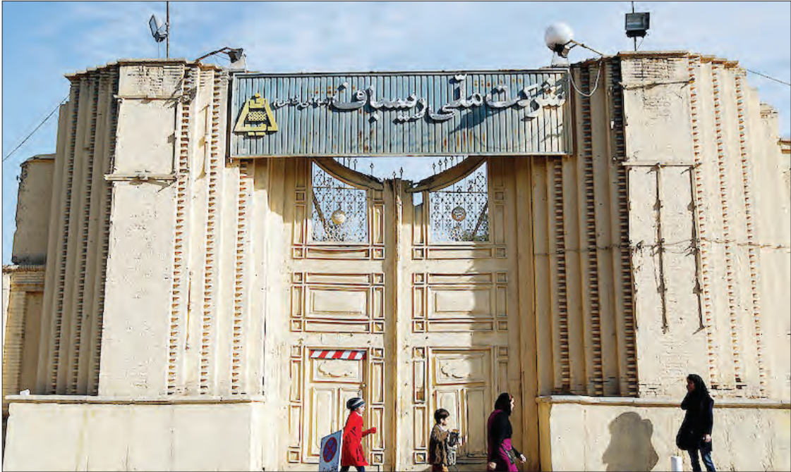
محسن پناگه‌طالع، وزیر راه و شهرسازی

وزارت راه و شهرسازی ساختمان کارخانه ریسباف اصفهان را با قیمت ۲۰۷ میلیارد تومان برای تبدیل به موزه خرید