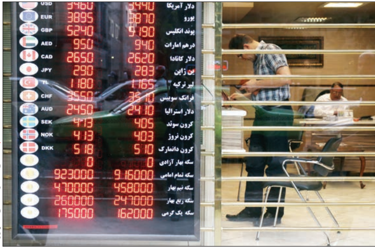
تکمیل ستاره‌های کلیدی / شهروند

۱۲۴ معامله‌گر بزرگ ارز به سازمان امور مالیاتی معرفی شدند | گام‌های اول ارز تک نرخ برداشته شد | دلار چند نرخ معادل ۸۰ درصد بودجه آموزش و پرورش به جیب دلالتان سرازیر کرد