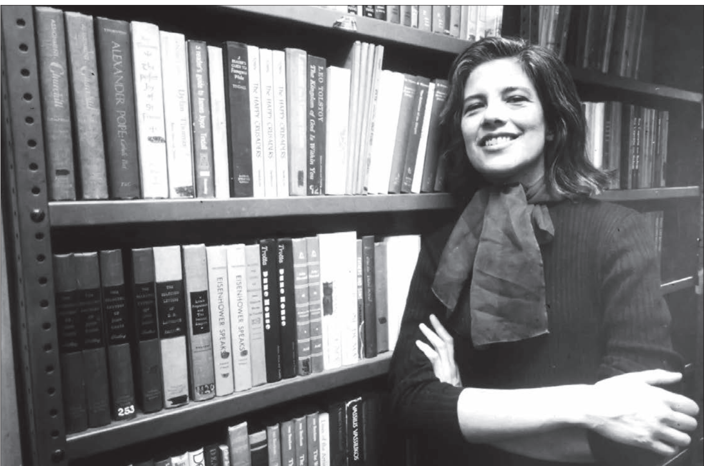
۱۲۸ سال پیش، برابر با بیست و هشتم دسامبر ۲۰۰۴ میلادی، سوزان سونتاگ، نویسنده، نظریه پرداز ادبی و فعال سیاسی در نیویورک گذشت. از سونتاگ مقالات بسیاری با موضوعات عکاسی، فرهنگ و رسانه، ایدز و بیماری، حقوق بشر، کمونیسم و ایدزولوژی چاپ رسیده است. مقالات و سخنرانی‌های او گاهی مورد انتقاد جدی واقع می‌شدند و به همین دلیل مجله نقد کتاب نیویورک او را یکی از با نفوذترین منتقدان نسل خود نامید. سونتاگ علاوه بر نگارش، سفر به مناطق متلتهب جهان را هم جدی می‌گرفت. حضور در جنگ ویتنام و سفر ایووو، عناصر مهم در زندگی او بوده است. سونتاگ فعالیت‌های اجتماعی را هم در کنارش دنبال می‌کرد.