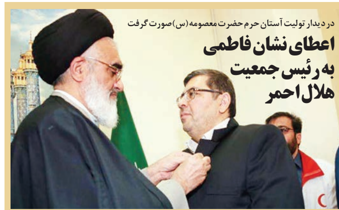
در دیدار تولیت آستان حرم حضرت معصومه (س) صورت گرفت

اعطای نشان فاطمی به رئیس جمعیت هلال احمر