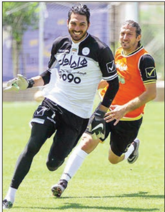
سایپا هم هر کدام یک نماینده در تیم ملی دارند، ضمن این که ۱۱ بازیکن تیم ملی هم لژیونر هستند

هرچند که سرمربی هر تیم مختار است باز یکتائی را دعوت کند که می‌تواند نقش‌های او را در زمین اجرا کند اما تیم چند مهره سرشناس در لیست تیم ملی حسابی شگفت‌انگیز است. علاوه بر بیرون آمدن که به دلیل مصدومیت نتوانست ایران را در مقابل سوریه همراهی کند و همراه با پرسپولیس به دوی رفته، حاج‌صفی و سردار آزمون هم به دلیل جرایم انضباطی نمی‌توانند برای ایران به میدان بروند ولی در این میان غیبت آندرانیک تیموریان، علیرضا حقیقی، سعید آقایی