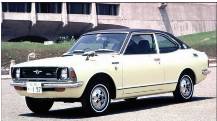
▲ تویوتا کورولا مدل ۱۹۷۰