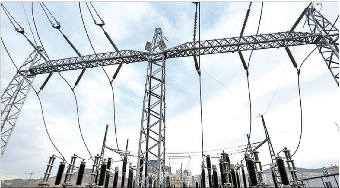
فوی تربر درایم.

◀ دبیر کنفدراسیون صادرات انرژی در گفت‌وگو با «شهروند»: سرمایه‌گذاری در صنعت برق ایران توجیه اقتصادی ندارد