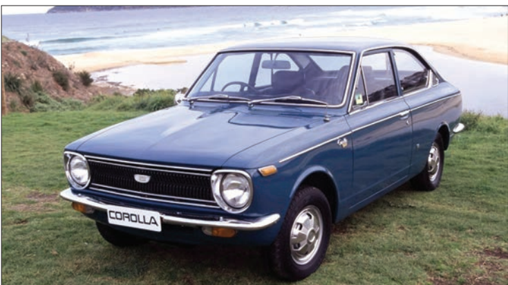
▲ نسل اول تویوتا کورولا ۱۹۶۶

رویتز | تویوتا کورولا که یکی از پر فروش‌ترین خودروهای سواری جهان است، این هفته ۵۰ساله می‌شود. از زمانی که نخستین مدل کورولا در پنجم نوامبر سال ۱۹۶۶ در ژاپن به فروش رفت تا پایان سپتامبر، حدود ۴۴٫۳ میلیون کورولا شامل کورولا فیلدر و انواع دیگر این خودرو در سراسر جهان به فروش رفته‌اند. در اواخر دهه ۱۹۵۰ که اقتصاد ژاپن در حال احیاء از دوران جنگ جهانی دوم بود، خودروسازان تصمیم گرفتند خودروی ارزانی برای خانواده‌های متوسط که بیشتر آنها خودرودنداشتند، تولید کنند.تویوتاموتور ابتدا مدل پالیکارا عرضه کرد که چندان مورد استقبال قرار نگرفت. در سال ۱۹۶۶، مدل دودر کورولا را باهدف تولید ۲۰هزار دستگاه در ماه معرفی کرد، آن هم در شرایطی که کل تولید ماهانه این شرکت ۵هزار دستگاه بود. این خودرو به خوبی فروش رفت و سه‌سال بعد از عرضه، کورولا پر فروش‌ترین خودروی ژاپن شد و به آغاز دوران صنعتی شدن این کشور کمک کرد. براساس گزارش رویترز، کورولا پس از این که به مدت ۳۳سال متوالی پر فروش‌ترین مدل ژاپن بود، در سال ۲۰۰۲ این عنوان را به هاج یک فیت هوندا موتور و اگانرا کرد. در این خودرو از تویوتا اکویا و مدل هیبریدی پریوس پر فروش‌تر است. زیرا مصرف‌کنندگان ژاپنی خودروهایی را ترجیح می‌دهند که مصرف سوخت بهینه‌تری دارند. با این همه چشم‌انداز کورولا در ژاپن چندان روشن نیست، زیرا بازار خودرو با کاهش جمعیت کوچکتر می‌شود. فروش داخلی کورولا اکنون حدود یک چهارم اوج فروش ۴۰۰ هزار دستگاه در سال ۱۹۷۳ است اما کورولا در آمریکا باز ابتدای سال جاری میلادی تاکنون دومین خودروی سواری پر فروش پس از تویوتا کمری بوده است.