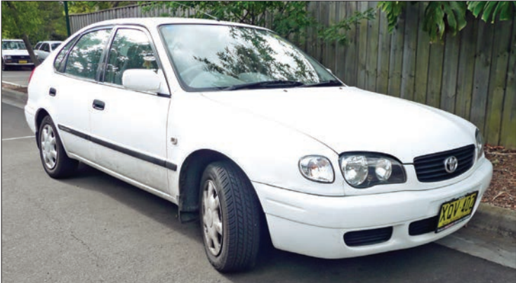
▲ تویوتا کورولا مدل ۲۰۰۰