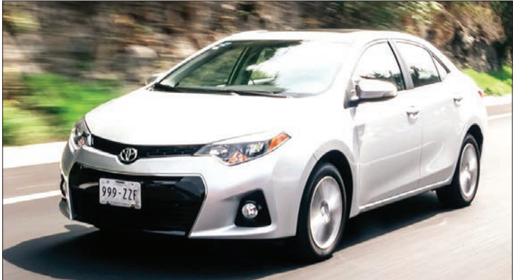
▲ تویوتا کورولا مدل ۲۰۱۶