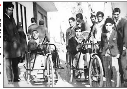
اهدای ویلچر، توسط جمعیت در سال ۱۳۴۷