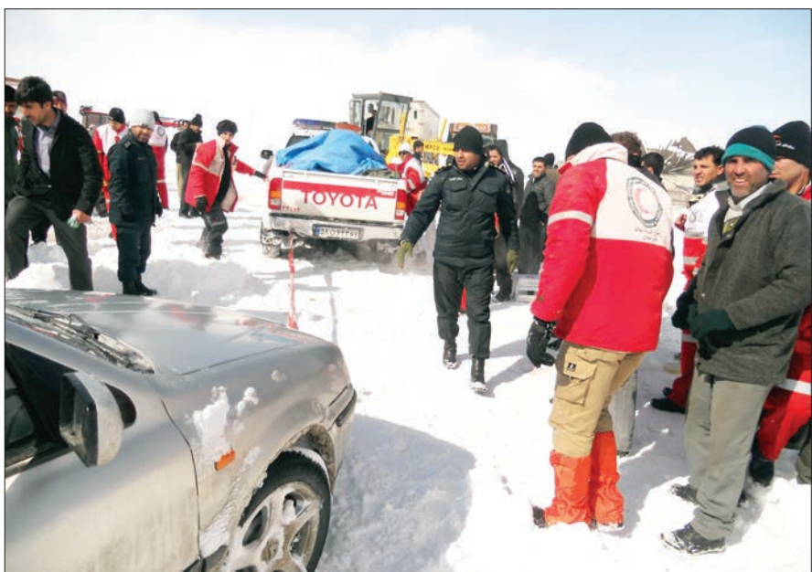
امداد در یخبندان