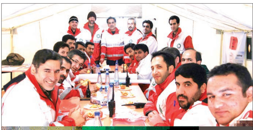
جانبازان هلال احمر