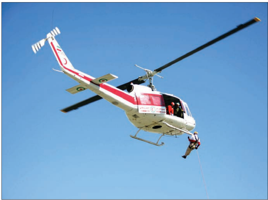
بانگر جمعیت هلال احمر همدان