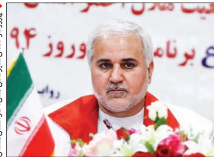
بهر روز کار خنده‌های مدیر عامل هلال احمر استان همدان