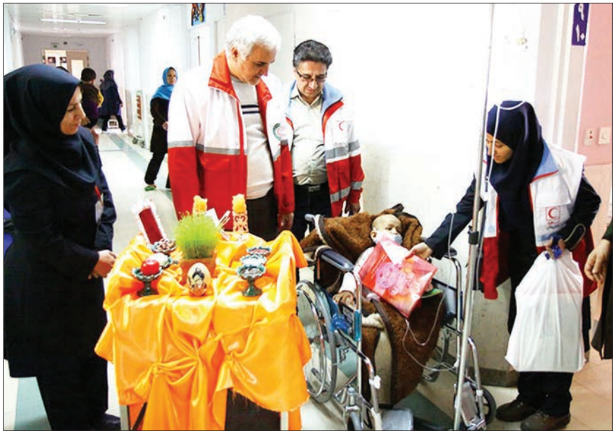
همیاران هلالی‌ها در یک کارگاه آموزشی