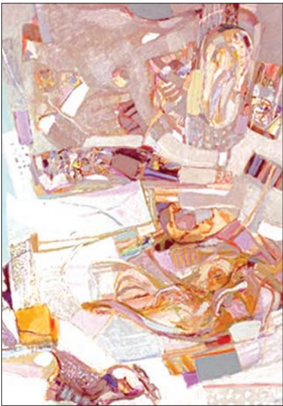
اثر شفیق عبود هنر مند لبنانی - قیمت فروش ۳۹۱ هزار و ۵۰۰ دلار