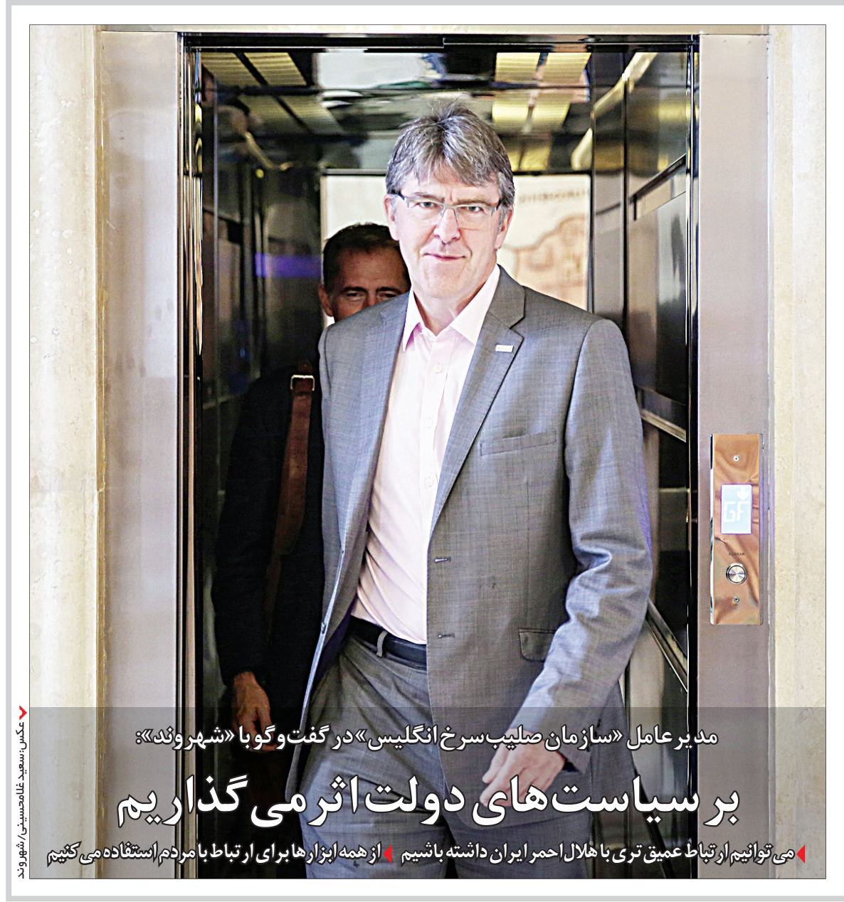
مدیر عامل «سازمان صلیب سرخ انگلیس» در گفت‌وگو با «شهر و شهر» بر سیاست‌های دولت اثر می‌گذارد می‌توانیم ارتباط عمیق‌تری با هلال احمر ایران داشته باشیم. از همه ابزارها برای ارتباط با مردم استفاده می‌کنیم

قضاتی که از جایگزین‌های حبس استفاده می‌کنند، تشویق خواهند شد