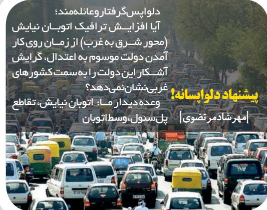
دلوایس گرفتار وعائلهمند؛

آیا افزایش ترافیک اتوبان نیایش (محور شرق به غرب) از زمان روی کار آمدن دولت موسوم به اعتدال، گرایش آشکار این دولت را به سمت کشورهای غربی نشان می‌دهد؟