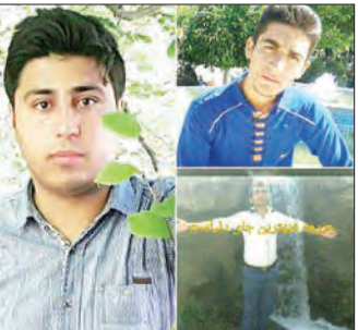
عکس های پربلا

جاده های منطقه معان حادثه خیز است و هر سال در اثر تصادفات رانندگی چندین نفر جان خود را از دست می دهند. در اوایل این هفته نیز در یک تصادف رانندگی دیگری چهار نفر که دونفر آنها کودک بودند، جان خود را از دست دادند. پارس آباد معان در شمال استان از دیبل و مجاورت جمهوری آذربایجان واقع است.