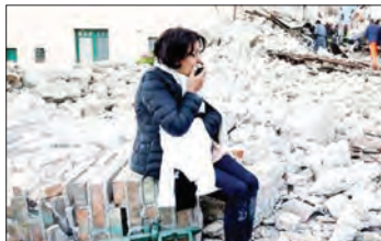
عکس های پربلا