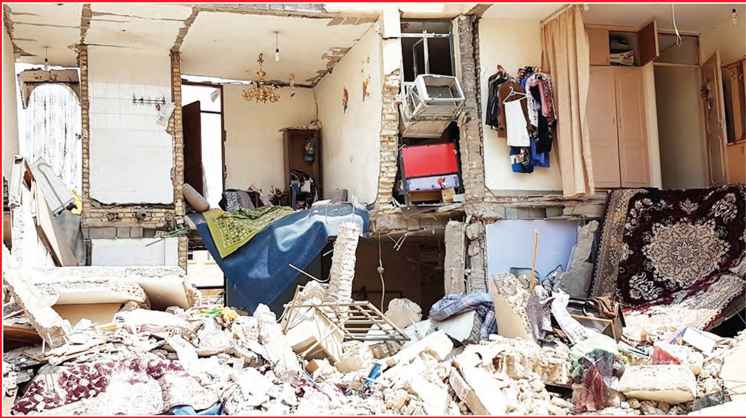
عکس های پربلا

هستند. مصدومان نیز بلافاصله پس از عملیات نجات و اورژانری به بیمارستان های گلستان، امام خمینی (ره) و طالقانی اهواز منتقل شدند. به گفته مدیر کل اورژانس استان خوزستان، حال برخی از مصدومان این حادثه وخیم است و احتمال افزایش تلفات این حادثه وجود دارد. در همین حال ناصر چرخساز، رئیس سازمان اسداد و نجات هلال احمر از پایان عملیات اورژانری و جست و جوی در این حادثه خبر داد و گفت: «دقایقی پس از وقوع این حادثه، با توجه به شدت انفجار و تخریب گسترده چند امداد مسکونی، ۲۰ امدادگر در قالب ۵ تیم اورژانری و جست و جوی به محل اعزام شدند.»