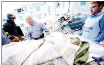
عکس های پربلا

نوشت: دولت با آژانس های حفاظت شهری به طور کامل واز نزدیک در ارتباط است. اطلاعات اولیه نشان می دهد تعدادی از ساکنان منطقه در زیر آوار گرفتار شده و تعدادی دیگر نیز از مناطق زلزله زده گریخته اند. موسسه لرزه نگاری آمریکا هم اعلام کرده که پس لرزه ها تا چند روز یا حتی چند هفته ادامه خواهد یافت. این در حالی است که ملی پو شان ما که در ایتالیا به سر می برند، در منطقه کورچینو فلورانس ایتالیا روزه دانه دو از محل وقوع این زلزله دور هستند. امروز ۲ شهریور ماه، اردوی تیم ملی در این کشور به پایان می رسد. این در شرایطی است که انتظار صدها کشته و زخمی می رود. منبع خبری محلی اعلام کرد بیمارستان شهر که به شدت تخریب شده، نمی تواند به زخمی ها خدمات رسانی کند. بیماران این بیمارستان به جهت حفظ امنیت جانی شان به خیابان منتقل شدند. در حال حاضر نیروهای امدادی زیر آوار به دنبال اجساد و زخمی شدگان می گردند و این در حالیست که احتمال پس لرزه ها هنوز وجود دارد. چندین پس لرزه بعد از زمین لرزه اصلی رخ داده است که هر چند شدت آن کمتر از زلزله اول بود اما موجب خرابی بیشتر ساختمان ها شده است.