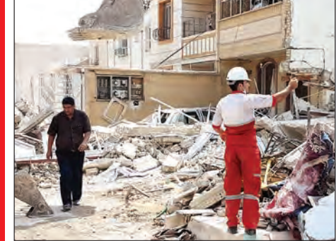
عکس های پربلا

ساکنان این محله صبح چهارشنبه با صدای مهیبی از خواب پریدند. انفجاری که موج آن شیشه های خانه های خیابان سعادت اهواز را شکست و صدای آن در خیابان های اطراف هم شنیده شد. این انفجار که در یک آپارتمان ۴ طبقه رخ داد کشته و ۸ مجروح به جای گذاشت. به گفته مقامات محلی، شدت انفجار به حدی بوده که ۲ واحد این مجتمع مسکونی به کلی تخریب و به ساختمان های مجاور هم خسارت های سنگینی وارد شد. در همان ابتدای وقوع این حادثه تیم های عملیاتی شامل خودروهای اطفای حریق و امداد و نجات این سازمان