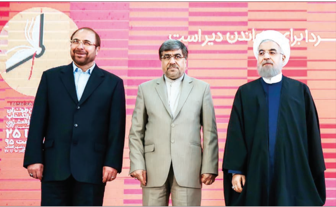
محمدباقر قالیباف (وسط)، استاندار تهران (راست) و محمدباقر قالیباف (چپ) در جریان بازدید از نمایشگاه بین‌المللی کتاب تهران.

محمدباقر قالیباف: نمی‌شود در شهری زندگی کنیم که تعداد مغازه‌های لوازم آرایشی ۸ هزار و تعداد کتابفروشی‌ها ۱۲۰۰ واحد باشد