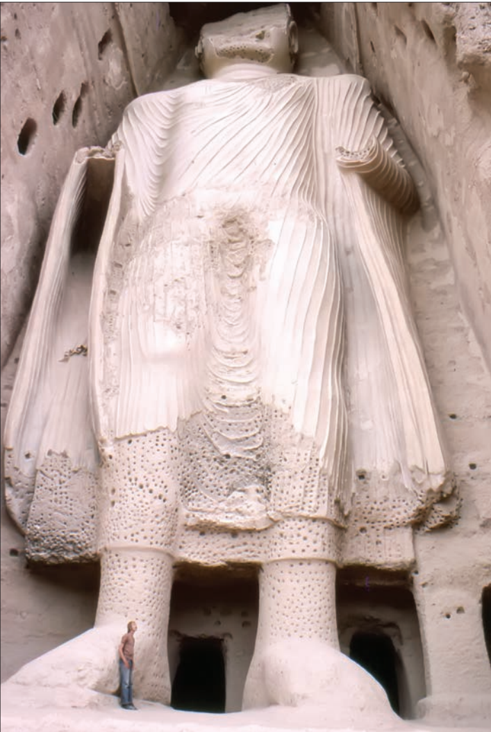
۱۵۰ سال پیش، برابر با یازدهم مارس ۲۰۰۱ میلادی، مجسمه‌های بودا در افغانستان به دستور ملاحمد عمر و توسعه‌گرده طایان کاملاً تخریب شدند. این تندیس‌ها هر بلندای ۵۳ متر در دل کوه‌های استان بامیان افغانستان ساخته شده و در کنار مجموعه‌ای از بناهای تاریخی در این محل برای زمینی طولانی از جای‌های اصلی گردشگری در افغانستان بودند. بر اساس تواریخ موجود تندیس کوچگتر در سال ۵۰۷ میلادی و تندیس بزرگتر در سال ۵۵۴ میلادی ساخته شده بود.