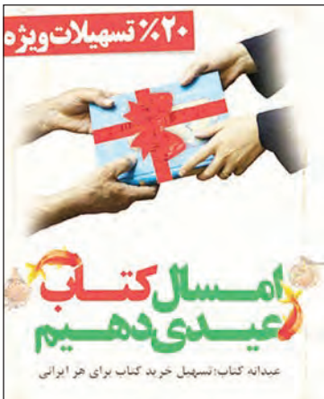
عیدانه کتاب تسهیلات ویژه خرید کتاب برای خرد ابروانی

کتابخوانی، هم‌زمان با آغاز سال نو تسهیلاتی را در قالب پارانه خرید کتاب از طریق کتابفروشی‌های سراسر کشور، مستقیماً به خریداران کتاب پرداخت می‌کند. در این طرح برخی کتابفروشی‌ها، کتاب‌های خود را که با شرایط تعیین شده در این طرح مطابقت داشته باشند، با ۲۰ درصد تخفیف به خریداران می‌فروشند، موسسه‌خانه کتاب به نمایندگی از طرف معاونت امور فرهنگی مبلغ تخفیف را به کتابفروشان پرداخت خواهد کرد. البته استقبال مردم از این طرح، قطعاً فقط به جهت تخفیف نبوده است. کتابفروشان از این طرح استقبال کرده، رسانه‌ها به جهت وضع اسفبار فروش کتاب این خبر را بازنشر کردند و مردم نیز برای حمایت از کتاب حضور پیدا کردند. گودرزی در گفت‌وگو