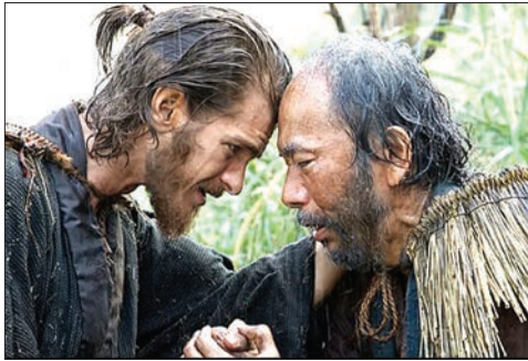
در ویدئو سزار/ برادران کوئن