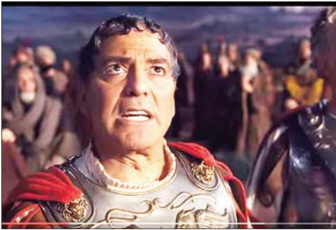
در ویدئو سزار/ برادران کوئن

◀ ۲۰۱۶ در تسخیر کدام کارگردان‌ها خواهد بود