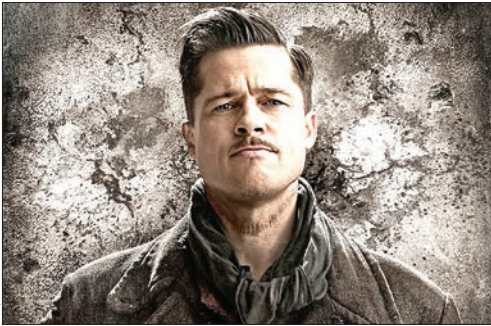
ملبش جنگی/ دیوید فیوچارد

جشنواره فیلم برلین ۲۰۱۶ تجربه خواهد کرد، فیلمی است حماسی با بازی جورج کلونی در نقش سزار که البته شامل درون‌مایه‌ای کم‌دی نیز است. داستان فیلم که در دهه ۱۹۵۰ میلادی روی می‌دهد، درباره پشت‌صحنه شلوغ و پر دردسر ساخت یک فیلم هالیوودی و زنده‌شدن سزار بازیگر نقش اصلی فیلم، با بازی جورج کلونی است.