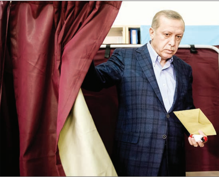
رئیس‌جمهور ترکیه، رجب طیب اردوغان

استقرار ۳۸۵ هزار نیروی امنیتی در سراسر ترکیه برای تأمین امنیت انتخابات