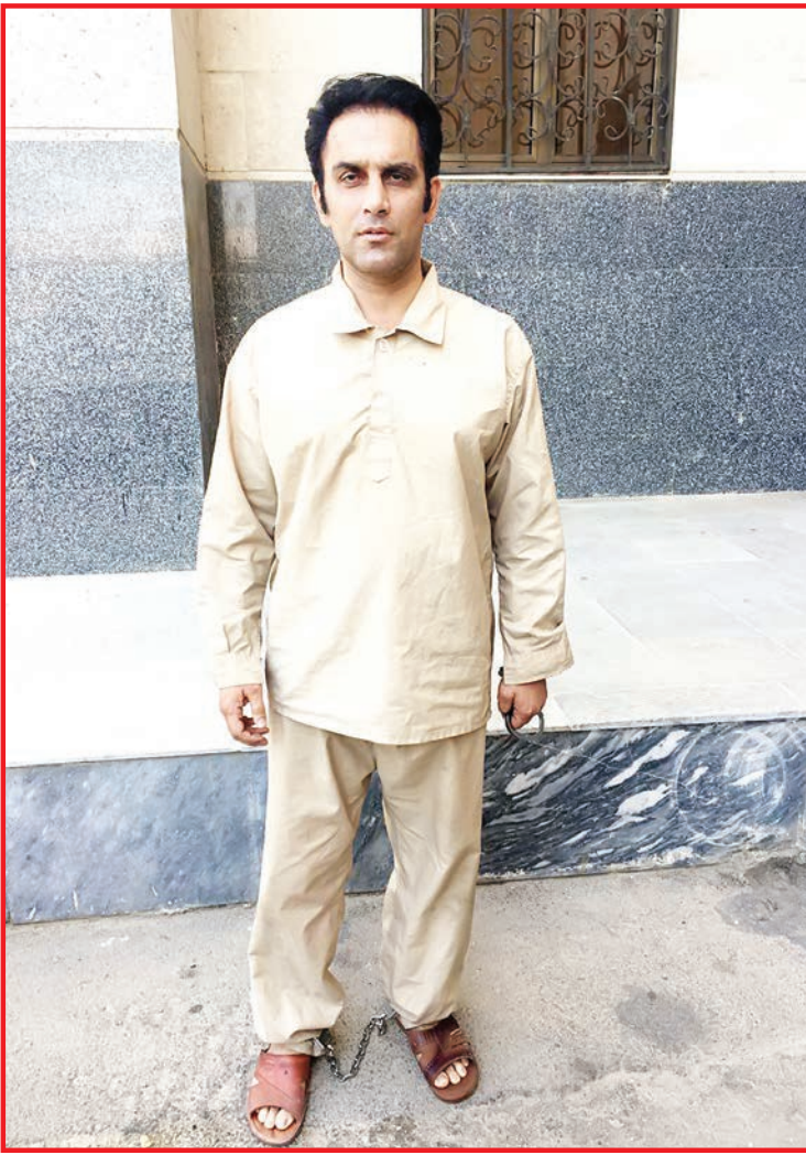
چهره بدون پوشش خواستگار قلبانی با نقاشی‌های باز پرس بر توده مشتمل می‌شود

بنابراین با توجه به شگرد سارقان در خرید سکه از طلافروشی‌های جنوب شهر تهران به‌ویژه در منطقه شهرک ولیعصر کارآگاهان احتمال دادند که سارقان باز هم برای خرید دوباره طلا به این مغازه‌ها مراجعه می‌کنند. برای همین کارآگاهان آموزش‌های لازم را به تعدادی