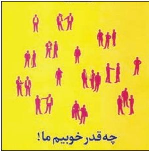
چه قدر خویم ما!

شوخی‌طبعی از همان عنوان کتاب شروع می‌شود: «چقدر خویم ما!» و نویسنده مدح تشبیه به دمی را منسوب می‌کند به ما. ابراهیم رها، سال‌ها در مطبوعات به طنز نویسی شهره بوده؛ از اعتماد و سرمایه بگیر تا چلچراغ و فرهنگ آشتی و ... حالا هم رسیده به وطن و طنز درباره ما ما مردمی که به قول رها «زبید، جدار و مطبخ و راننده» و «اعتماد بنفش مان یک جاهایی از آسمان را انشقاق داده»؛ او سبزه‌خورد و کتابش را جدی‌ترین کار طنز خود می‌داند، از آن جهت که پیکان انتقاد را هدف گرفته و به خوش به مثابه نمونه‌های از ما، ما ایرانی‌ها، رها، درباره این کتاب به ما گفت: «من در این سال‌ها چون مدام کار طنز می‌نوشتم، دیگر فراغتی نداشتم تا کاری در حد کتاب بنویسم. چون اعتقاد دارم مطلب مطبوعاتی صبح متولد می‌شود و تا شب نرسیده می‌میرد. گاهی پیش می‌آید که در ماه حدود ۱۰۰ ستون طنز می‌نوشتم اما همچنان اعتقاد دارم برای انتشار کتاب باید چیزی متفاوت از مطالب مطبوعاتی ارایه کنم. به همین