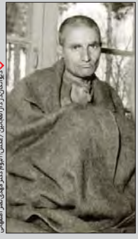
دیوانگان در دارالمجانین، نگارگری: اکرم کبیر