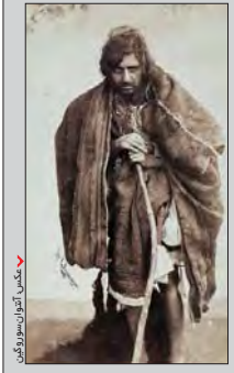
دیوانگان در دارالمجانین، نگارگری: اکرم کبیر، تصویر: ناصر اسپهانلی