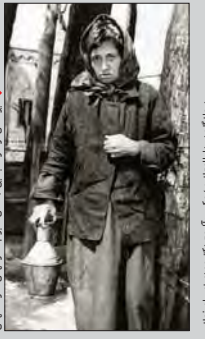
دیوانگان در دارالمجانین، نگارگری: اکرم کبیر