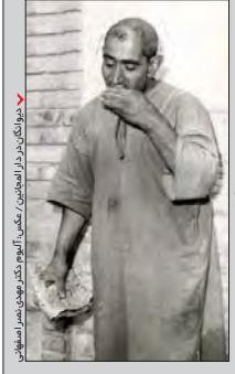
دیوانگان در دارالمجانین، نگارگری: اکرم کبیر

روایتی از بر خور دجامعه ایرانی با پدیده «دیوانگی» در تاریخ