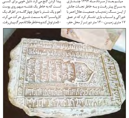
یکی از نقشه‌خوان‌ها می‌داند این لوح یک نقشه گنج به جاذبه‌ها در دوران صفویه است