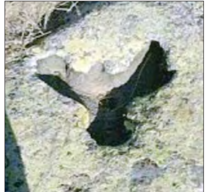
نشانه‌هایی از نشانه‌های هروف‌های جستجوگران است/ بیابان‌های اطراف شازند