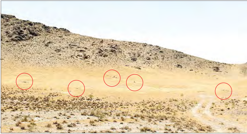
مختصات یک مکان در دل بیابان که در تصویر بالا مشخص شده است. مختصات این مکان در تصویر بالا مشخص شده است.