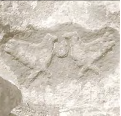
نشانه‌پرده از نشانه‌های هروف‌های جستجوگران در بیابان‌های اطراف دلیمان