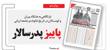
روایت نو بازنگاهی به جایگاه پیران و کهنسالان در تاریخ خانواده و جامعه ایرانی پاییز پدرسالار ۹ صفحه