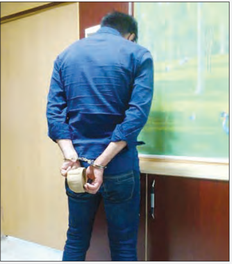
ماموران کلاتری گفت: «این مرد چند روز پیش هم به مغازه من آمده بود. او سرویس های طلای مغازه مرا دید و در نهایت یک سرویس

شهریاد | پارچه فروش ور شکسته برای پرداخت ۲۸۰ میلیون بدهکاری خود، نقشه سرقت مسلحانه از یک طلا فروشی را اجرا کرد اما پیش از انجام هر گونه اقدامی از سوی پلیس غافلگیر شد. صبح دیروز مرد جوانی به یک مغازه طلا فروشی در خیابان سجاده شمالی رفت. قیمت سرویس های طلا را می پرسید. مغازه شلوغ بود. می خواست معطل کند. نقش بازی کرد. گوشی تلفن همراهش را از جیبش بیرون کشید و مشغول صحبت شد. هنوز فروشنده نمی دانست هدف نقشه مسلحانه یک سارق شده است. همه چیز عادی بود و کسی حتی نمی توانست به موضوع مشکوک شود. اما درست در لحظه ای که مغازه خلوت شد و فروشنده سرش را برای انجام کاری برگرداند ناگهان یک اسلحه را پشت سر خود احساس کرد و بعد از آن این جمله را شنید: «هر چه طلا داری بریز روی میز و مطمئن باش که اگر واکنشی نشان دهی تو را می کشم». فروشنده که حساسی تر رسیده بود، تسلیم نشد و به جای اینکه به حرف سارق گوش کند با او درگیر شد. صدای تیر شلیک شده از اسلحه کافی بود تا راز این سرقت مسلحانه فاش شود. چند دقیقه بیشتر طول نکشد که ماموران گشت کلاتری ۱۶۱ اوبور پس از اطلاع از این حادثه به طلا فروشی رفتند و پیش از اینکه دزد جوان بتواند فرار کند او را دستگیر کردند.