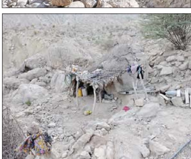
وار دکردن کالاهای موردنیاز خود از خارج بحدافل روستا معبور هستند. از حیوانات چهار یا استفاده کنند . همچنین بملت معبالعبور بودن مسیر و دشــواری فر اوان، کــودکان دانش آموز در این روستا با خطرهــای فر اوانی برای سیدن به مدر سهر و بودن مستند که حتی خطر جانی بر ای این دانش آموز ان دار د. سیدن به مدر سهر و به رو هستند که حتی خطر جانی بر ای این دانش آموز ان دار د.