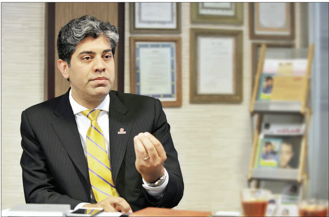
مدیرکل بنیاد کودک آمریکا در گفت و گو با «شهر وند»