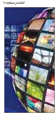
ادامه در صفحه ۱۰