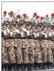
ادامه در صفحه ۱۰