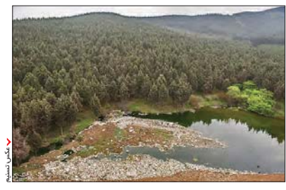
مروزگاری تپدههای سبوگله (هز ار پیچ) از معروفترین نقاط گردشگری گرگان بودند، اما حالا ۱ ۱ سال است که بده حل انباشت تر بالمهای انسانی تبدیل شده اند. بیش از یک سال پیش بودکه هسئولان استانی وعده ساخت