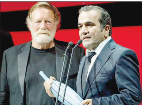
فیلم کوتنبرگ سوئد و همچنین جایزه بهترین فیلمنامه از شانزدهمین دوره جشنواره بین‌المللی فیلم پوسان کره جنوبی را دریافت کرده بود. در اختتامیه جشنواره بین‌المللی فیلم «فانتاسپورتو» جایزه ویژه هیأت داوران

به فیلم سینمایی «پل رایو» El Rayo به کارگردانی «رنستو دی نوفا» از کشور اسپانیا و همچنین جایزه بهترین کارگردانی به «شیم سونگ بوس» برای کارگردانی فیلم سینمایی «هایموو» Haemoo از کشور کره جنوبی افتاد شد، که فیلم افتتاحیه جشنواره نیز بود. جشنواره بین‌المللی فیلم «فانتاسپورتو» که یکی از جشنواره‌های معتبر سینمایی به‌شمار می‌رود در سی و پنجمین دوره خود پذیرای ۲۰۰ فیلم از ۲۶ کشور جهان بود که در چندین بخش رقابتی و غیررقابتی، از جمله: بخش رقابتی اصلی، بخش رقابتی «هفته کارگردان»، بخش رقابتی «فیلم کوتاه»، بخش «حمایش ویژه»، بخش غیررقابتی «بانوراما»، بخش فیلم‌های ویژه، بخش غیررقابتی «کلاسیک»، بخش جشن صدمالگی تولد کارگردان سرشناس «ورسن ولز»، بخش «فیلم‌های صنعتی»، بخش غیررقابتی «فیلم کوتاه»، بخش «جلسات نقد و بررسی فیلم‌ها»، بخش «هنسنت‌های تخصصی در مورد هنر سینما»، بخش «کارگاه‌های تخصصی» و همچنین چندین بخش دیگر در روزهای ۱۷ تا ۱۶ فروردین ماه جاری در سالن تئاتر «ریغولی» Rivoli در شهر پورتو ریخت شمال کشور پر تغال برگزار شد.