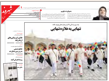
تنگناهای تنهایی به علاوه تنهایی