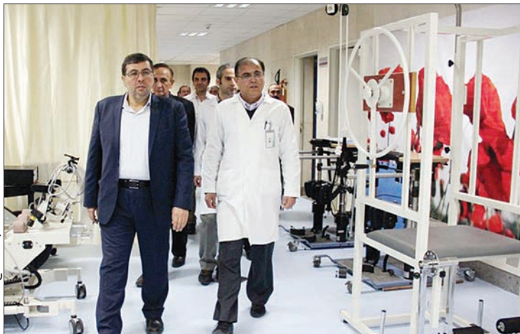
دکتر ضیایی در بازدید از بیمارستان نورافشار

وزارت بهداشت اعلام آمادگی کرده مسئولیت ارائه خدمات توانبخشی در کشور را به هلال احمر واگذار کند