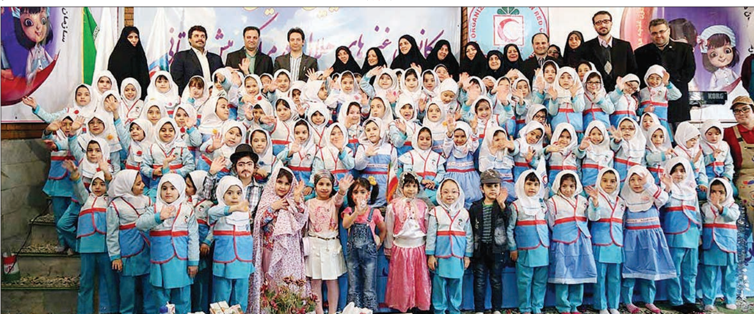
عکس از امدادگاران