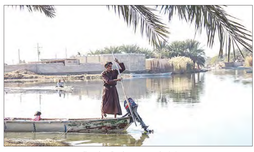
دغدغه هاى معيشتى مردمان ساكن حاشيه تالاب

ــا ورود یــک فروند کشـــتی ترانزیتی میرآباد و تخلیه آن در واگنهای حمل ریلی، برای نخستین بار ترانزیت ریلی سوخت در بندر امیرآباد صورت گرفت به گزارش روابط عمومی، مدیر بنادر و ، پانور دی و منطقه ویژه اقتصادی امیر آباد با اعلام ری را کار این خبر گفت:این محموله شامل ۵هزار و ۲۰۰ تن مازوت است کهاز کشور تر کمنستان به بندر امیر آباد واردُ شد. وی ادامه داد: اُینُ محموله پُس از تَخلیه در ۱۰۲ واگن ویژه حمل سوخت از طریق خطوط ریلی از بندر امیرآباد به بندر شهیدر جایی و سپس از راه دریا به کشـور امارات ترانزیت می شود. خدمتگزار در امه بااشــاره بــه بندر امیرآبــاد به عنوان حلقه صلی کریدور ترانزیتی شـمال-جنوب و تنها بندر شمال کشـور که متصل به راهآهن سراسری است، بروجود ۱۶ كيلومتر شبكه ريلي داخلي وهمچنيز سكله رو-روريلي وكاميون دراين بندر تأكيد كرد.