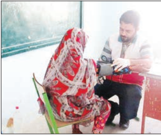
جوان فعال کانون دانشجویی هلال احمر دانشگاه آزاد اسلامی واحد بندرعباس در حال کمک‌رسانی به یکی از ساکنان روستای محروم «حسن‌لنگی»