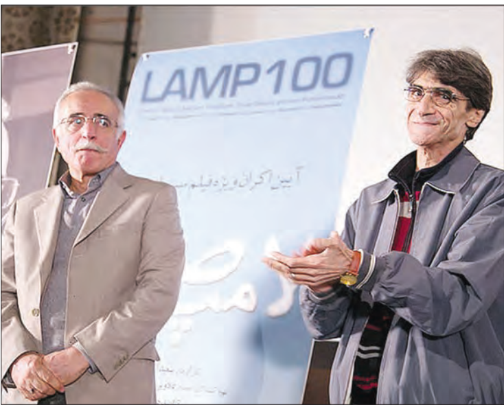
عکس هنر آتلیان

از این به بعد تقدیر از بزرگان سینمای ایران در کنار اکران خصوصی فیلم‌ها باب شود. ناصر تقوایی، کارگردان پیشکسوت سینما و تلویزیون تنها کسی بود که در این مراسم برای صحبت درباره «لامپ صد» اسکندری» به روی صحنه آمد. او می‌گوید صحبت کردن درباره عبدالله اسکندری سخت است و امروز به جرات می‌توان گفت هیچ فیلم موفقی در سینمای ایران ساخته نشده مگر آن که اسکندری طراحی کردیم آن بوده باشد و ادامه می‌دهد که: «اما سینمای‌ها او را بعد صد می‌کنیم و عبد یکی از مشهورترین اسم‌ها در سینمای ایران است.» تقوایی به درک عمیق اسکندری از شخصیت‌ها اشاره می‌کند و می‌گوید: «هنگامی که یک بازیگر با چهره‌پردازی ایشان جلوی دوربین می‌رود بازی برایش چندین برابر سهیل‌تر خواهد بود و اوست که به فیلمنامه فیلمنامه نویسان