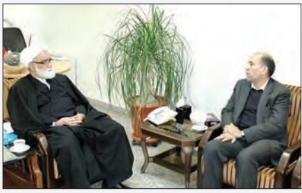
توصیف کرد و ادامه داد: «این خدمات باعث درخشش جمهوری اسلامی ایران است»

حجت الاسلام والمسلمین معزی: خدمات گسترده هلال احمر به زائران از افتخارات نظام جمهوری اسلامی ایران است