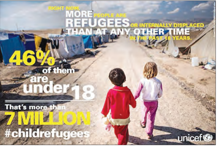
بیش از ۷ میلیون کودک در جهان آواره و پناهنده هستند.

شما خواننده گرامی می توانید بر اساس عکس چاپ شده در این بخش و بر مبنای اطلاعات مندرج روی عکس، هر گونه توضیح، ترجمه و خاطره های را برای ما ارسال کنید. ماه دیگر در همین روز و با همین شماره، این عکس مجدداً منتشر و مطالب رسالی شما به همراه آن چاپ خواهد شد. ایمیل: khanevadeh.shahrvand@gmail.com