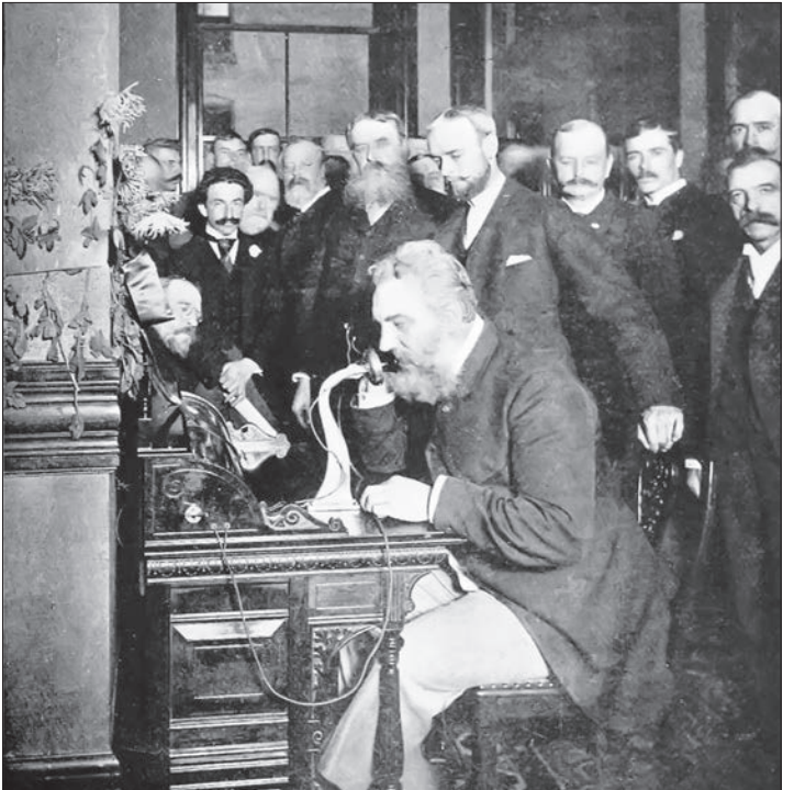
الکساندر گراهم بِل، در حال اجرای اولین تماس تلفنی از واشینگتن به شیکاگو، با حضور روزنامه‌نگاران، صاحبان صنایع و سیاستمداران (۱۸۹۲ میلادی) - توضیح در ستون تقویم تاریخ.

یک روز اگر فرصت کافی داشتید و به دنبال برنامه‌ای جامع و جالب برای سرگرم شدن می‌گشتید، به نزدیک‌ترین ایستگاه مترو محل سکونت‌تان رفته و دورترین نقطه‌ای را که می‌توانید با این اسب آهنی و زیرزمینی راهی آن شوید انتخاب کنید. یعنی آنقدر سرگرم می‌شوید و به قدری خوراک برای فکر کردن پیدا می‌کنید که مدت‌ها یادتان نرود! چطور؟ شما اگر برای خرید یا گشت و گذار به یک پاساژ معمولی نزدیک شهر بروید، نهایتاً ۲۰ یا ۳۰ متر راه خواهید دید. اما کافی است برای دقایقی چند در مترو باشید؛ چیزی که مانده بفروشند و هنوز پایش به مترو باز نشده و وسایل برقی است که آن هم احتمالاً به دلیل دست و پاگیر بودن و البته عدم وجود امکانات لازم برای واگن‌های ایستگاه و آزمایش صحت عملکرد این دستگاه‌هاست. قطارهایی که در مسیر تهران- کرچ حرکت کنند به دلیل دو طبقه بودن از قابلیت بهتری برای ایستادن برخوردارند. برخی شان گویی از بطن مادر فروشنده به دنیا آمده‌اند و چنان به کارشان مسلط‌اند