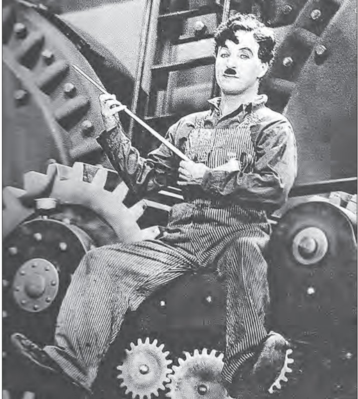
چارلی چاپلین در صحنه ای از فیلم «عصر جدید» (۱۹۳۶) [چاپلین در «عصر جدید» کارگرهایی را به تصویر کشید که کار فرماها (به طور کلی سیستم) از آن ها زیاد کار می کشند و تازه به این هم بسنده نکرده و در فکر افزایش ساعت کاری آنان هستند. ولی با تعطیل شدن کارخانه ها، همین کارگران به شکل بیگاری انی غم زده و بی پناه در سطح شهر روان می شوند پس آنکه سیستم فکری برای دوران عصرت آن ها داشت می باشد. خوش شانس ها شاید کاری کاذب برای خود بیابند و بعد اقبالها چاره ای جز دردی و در پیش گرفتن کارهای خلاف برای آسیر کردن شکم خود و زنی و پنهان پیدا نمی کنند. «عصر جدید» یکی از فیلم های است که کمیته فعالیت های ضد آمریکایی (با ریاست ستانور مک کار تری) را نسبت به کارهایش کمیونیستی چاپلین مشکوک کرد. کمیته ای که باعث اخراج این کارگردان با نفوذ عالم سینما از آمریکا در سال ۱۹۵۱ میلادی شد. دهم دستگاه مک کار تری ۲ سال بعد از هم با شیدا اما چاپلین تا سال ۱۹۷۲ به آمریکا بازگشت - توضیح در ستون تقویم تاریخ.