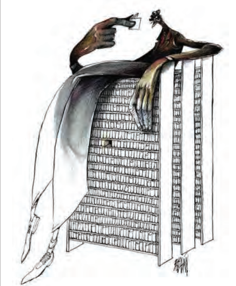
و پرورش اعلام کرد: با ارزیابی‌هایی که با دانشگاه فرهنگیان انجام شده، ادامه تحصیل فرهنگیان در مقاطع تکمیلی فراهم شده است. در این که نیروهای شاغل چه در بخش آموزش و پرورش و چه در

وقتی برنامه‌ریزی جامع اشتغال - آموزش وجود نداشته باشد و سازمان‌های آموزشی (مربوط به خرده‌نظام فرهنگی) اقدام به ارائه آموزش‌های غیرمتناسب با بازار کار کنند، تقاضای کاذب برای آموزش به وجود می‌آید و در یک دوره زمانی جامعه با پدیده «آموزش اضافی» روبه‌رو می‌شود. پدیده‌ای که سرمایه‌گذاری منابع محدود را از روش بهینه منحرف می‌کند و تصور نهایی این انحراف این است که تمام منابع صرف آموزش شود ولی هیچ فرصت شغلی جدیدی ایجاد نشود و بیکاری فارغ‌التحصیلان و مهاجرت متخصصان به کشورهای دیگر از پیامدهای آن است. پدیده آموزش اضافی دارای تبعات دیگری نیز است؛ مشکل، زمانی پررنگ‌تر می‌شود که این آموزش بدون کیفیت صورت پذیرد. اتفاقی که آن قدر مشهود است که جایی برای انکارش باقی نمی‌گذارد. با سرزدن به خیابان انقلاب می‌توان در تمامی رشته‌ها پایان‌نامه و مقاله علمی - پژوهشی خریداری کرد. چندی پیش علی‌اصغر فانی، وزیر آموزش