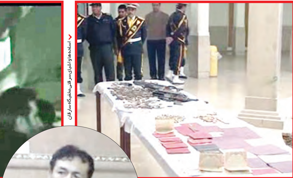
اسلحه‌ها و اشیای سرقتی مخفیگاه سارقان

حادثه خونین جاده‌های اصفهان از صبح روز شنبه ششم دی ماه آغاز شد. وقتی ۲ سارق مسلح با کرایه یک خودرو در جاده گلیایگان در حال فرار بودند، هیچ کس تصور نمی‌کرد آنها دست به کشتار بی‌رحمانه بزنند. سارقان در همان روز اول ۵ نفر را کشتند و ۶ نفر دیگر را زخمی کردند. تا این که یکی از آنها در تبادل آتش با پلیس به هلاکت رسید. اما این پایان فرار ۲ همدستش نبود، آنها که خود را در برابر اشد مجازات می‌دیدند، ستاروی فرار را همچنان ادامه دادند. این در حالی بود که پلیس سایه به سایه در تعقیب آنها بود. زندگی مخفیانه این ۲ مرد خشن آغاز شده بود، فراری که تنها ۶ روز دوام داشت و با کشته شدن یکی از آنها و دستگیری دیگری پایان یافت. تحقیقات پلیسی و بررسی سوابق فراری‌ها فرضیه مخفی شدن این مردان را در چند نقطه استان اصفهان قوت می‌بخشید. تا این که نیروهای پلیس با انجام کارهای اطلاعاتی و فنی توانستند رد آنها را در یکی از ساختمان‌های مسکونی فولاد شهر اصفهان پیدا کنند. با توجه به این که آنها در یک ساختمان مسکونی مخفی شده بودند عملیات سختی پیش‌روی نیروهای پلیس قرار داشت. با تعداد روز جمعه بود که عملیات ویژه پلیس در منطقه آغاز شد.