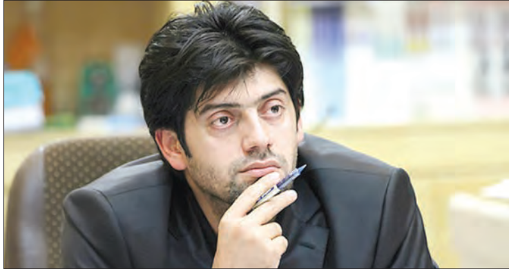
کرد: «گاهی اوقات اشکالات یا اختلاف سلیقه‌هایی وجود دارد اما اشکالاتی بر آن نیست زیرا در تقابل با اهداف هلال احمر نیستند و می‌تواند کمک کننده هم باشد»...