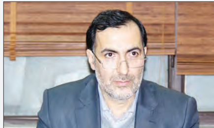
دبیر کل جمعیت هلال احمر گفت: «اگر در مان اضطراری حضور موثر و اثربخش نداشته باشیم مردم آسیب می‌بینند»...