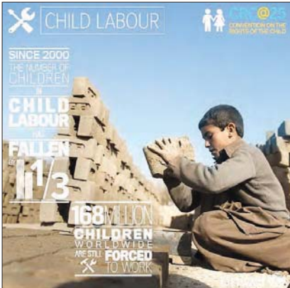
خود حق دارند بازی کنند اما در دنیای معاصر بسیاری از کودکان مجبورند برای بقای خود و خانواده در زمانی که بازی کنند، کار کنند.

شما خواننده گرامی می‌توانید بر اساس عکس چاپ شده در این بخش و بر مبنای اطلاعات منترج روی عکس، هر گونه توضیح، ترجمه خاطره‌های باارایان‌ما را سال کنید. ماه دیگر در همین روزها همین شماران‌ما را با عکس‌ها مجددا منتشر و مطالب‌سراسالی‌شماره‌ها را آن‌جا چاپ‌شده‌ایم! khanevadehshahrvand@gmail.com