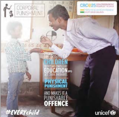
یک کودک باه و آسوزش اجباری رایگان (RTE) قانون، ۲۰۰۹، ممنوع می‌کند و آن را یک جرم قابل مجازات می‌داند.