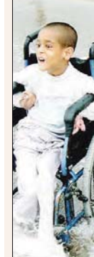
دانش آموزان استثنایی حساب باز کرد؟