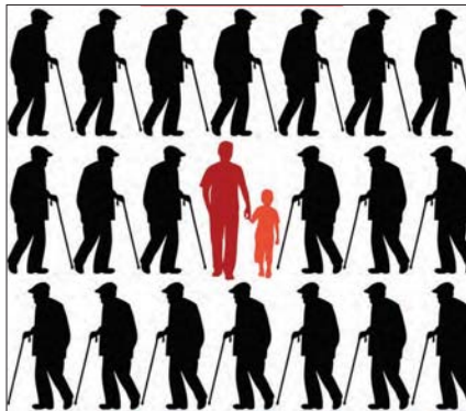
کاز، مراقبت و نگهداری از سالمندان که از پیش از این بر عهده نهاد خانواده بوده است، دچار مشکل شده. بررسی‌های انجام شده نشان می‌دهد که سالمندان با مشکلات معیشتی روبه‌رو هستند...