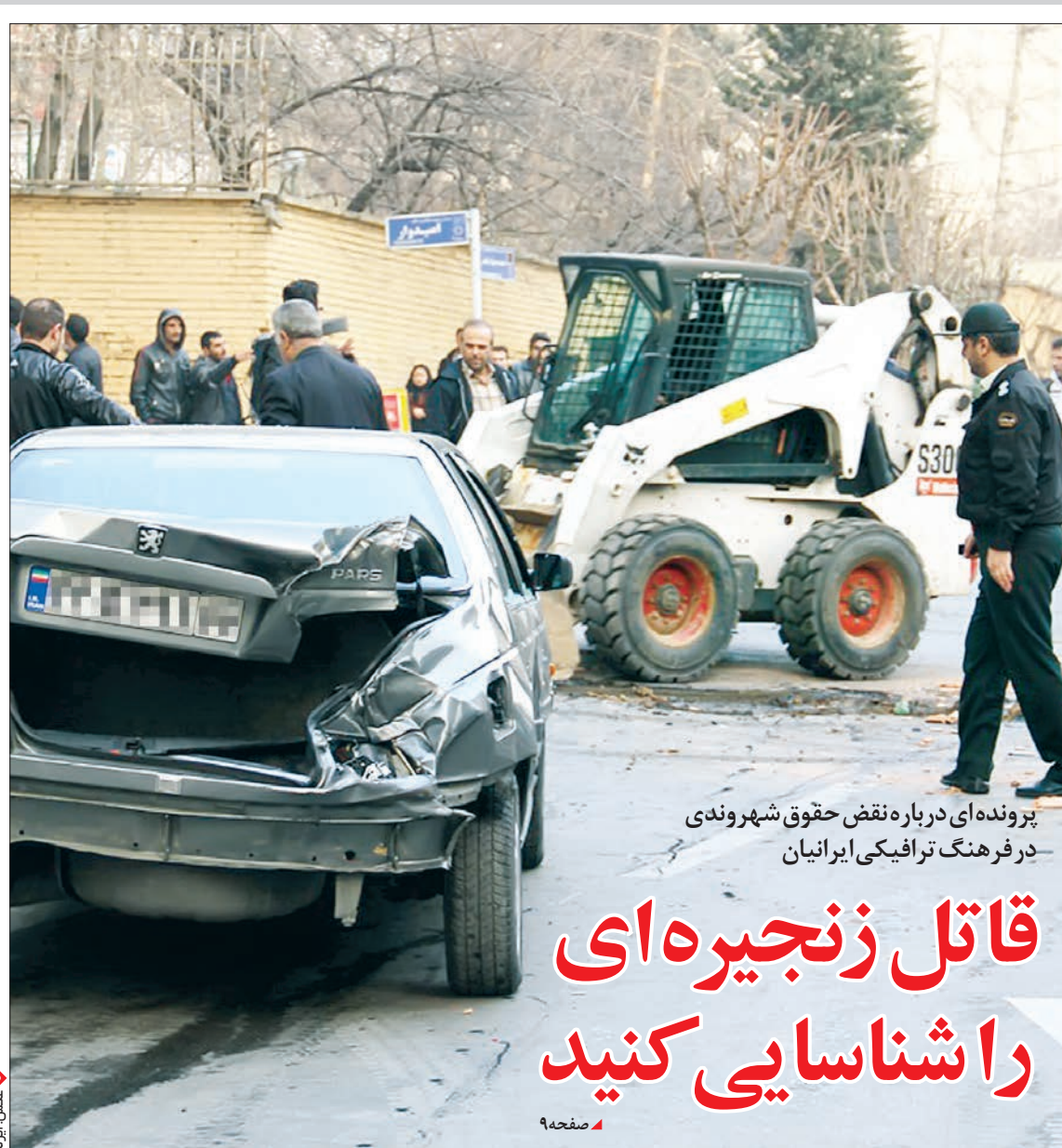
پرونده ای درباره نقض حقوق شهروندی در فرهنگ ترفیکی ایرانیان