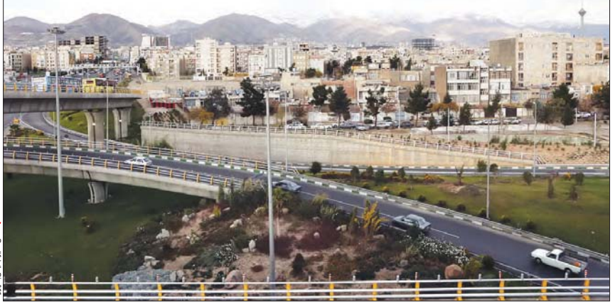
صحنه از پروژه شهریار