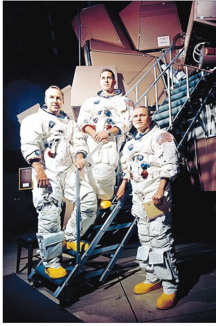
خدمه آپولو ۸، اولین فضایی‌هایی که مدار زمین را ترک کرد و به ماه رسید. از راست به چپ: فرانک بورمن، ویلیام آندرس، جیم لول - توضیح در ستون تقویم تاریخ.