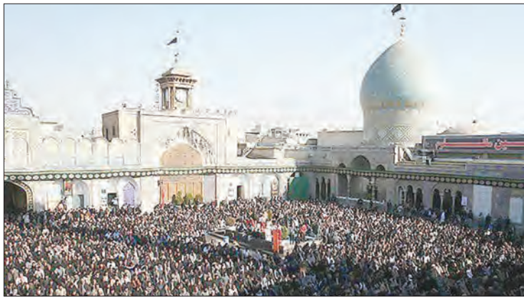
عکس‌های خبری از کاروان

نگاهی به امداد رسانی جمعیت هلال احمر در میعادگاه بزرگ عاشورایی در حرم عبدالعظیم حسینی (ع)